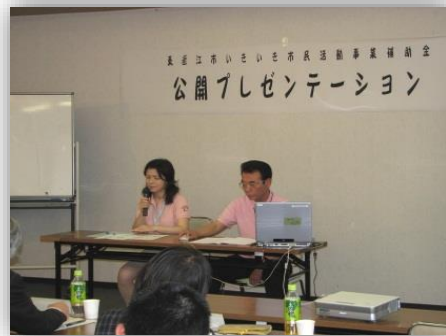
公開プレゼンテーション

6 月 東近江市いきいき市民活動 プレゼンテーション 「ビスタ指導のための会員のスキルアップとテキストづくり」事業