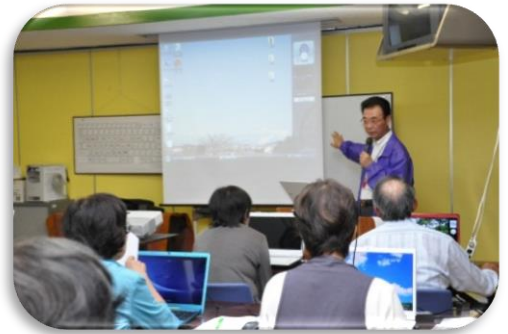
水車シニア講座① 谷講師