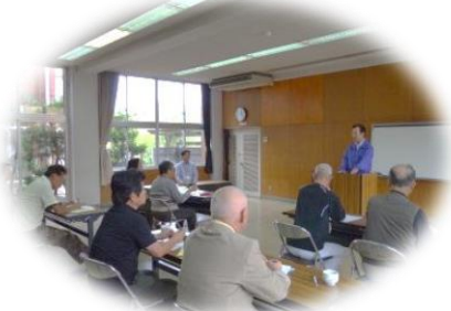
10 月 第 15 期ボランティア養成講座