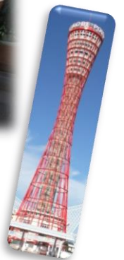
7 月 県外研修 (神戸方面)