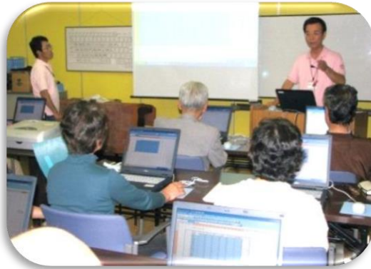
乙女浜講座・協講師