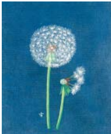
乳版画 タンポポ(鏡毛)