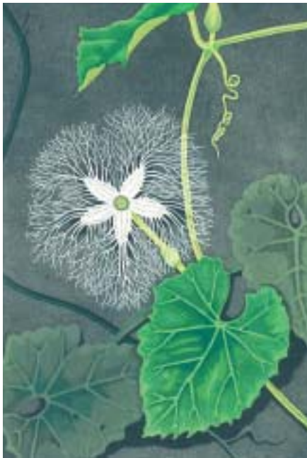
乳版画 カフスカリ

福井県鯖江市市生まれ。現在92才。1941年福井市内で謄写印刷会社「大坂謄写館」を開業。後に鯖江市に移転。1971年56歳から乳版や水彩で野の花を描き始める。1975年福井市の画廊「越美館」にて初個展。以降も鯖江市を中心に精力的に個展を開催。乳版画私家本「越前百花譜」「花爺句哉」などを発刊するなど、現在も乳版画や水彩画で野の花を描き続け活躍されている。