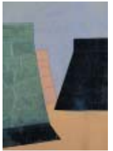
乳版画 岩根の石段