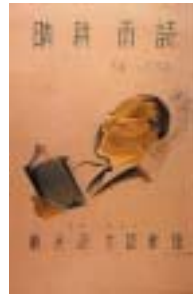
新書所記念図書部記念ポスター(乳版)

1930年(24才)、坂田郡鳥居本村(現彦根市鳥居本町)において滋賀県初の謄写印刷業「サンライズスタジオ」を創業、1938年には店舗を移転し、謄写印刷の受注および印刷機材の販売と同時に技術講習会を開催し技術を普及、滋賀県を二分する営業を展開する。1952年西日本乳版作家協会創立に参加。謄写印刷によって昭和の時代を映し出す多くの作品を生み出した。1981年没