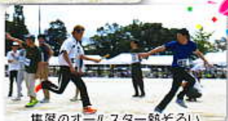
集団のオールスター競ぞろい