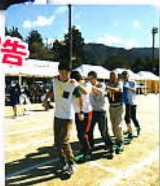
声を揃えて、いちに!!いちに!!