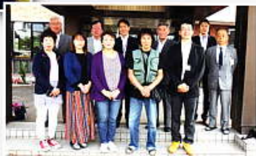
庁舎前にて集合写真