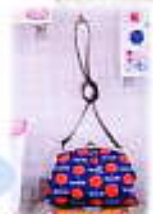
かわいいがま口の ショルダーバッグ