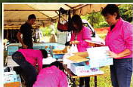
みんなで袋詰め作業