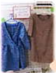
着物をリメイク チュニック&ワンピース