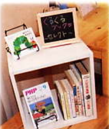
くるくるブック、おすすめ本コーナーを新設しました！

くるくるブックの雑誌コーナーで季節の情報をゲット！ 例えば・・・ 『旅の手帖』でローカル線の旅なんかステキですね♪