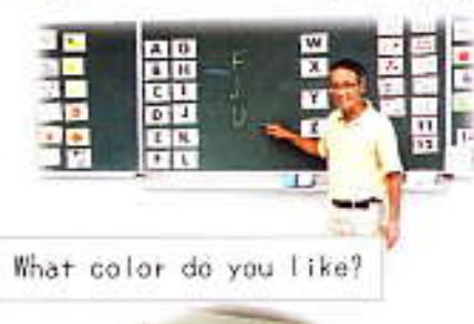
What color do you like?