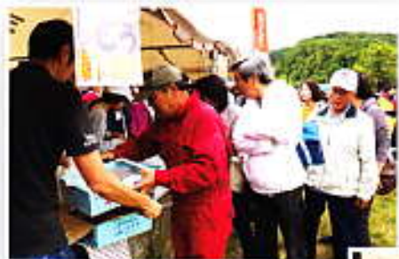
あっという間にぶどう完売