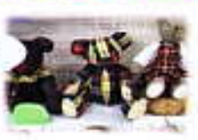
背広をリメイクした テディベア

秋風がさわやかな季節になってきました。読書の秋、文化の秋・食欲の秋…いろいろな秋を図書館で見つけてみませんか？