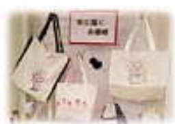
シンプルバッグに刺しゅう！