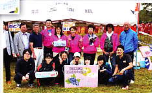
さあ、みんなでがんばるぞー!