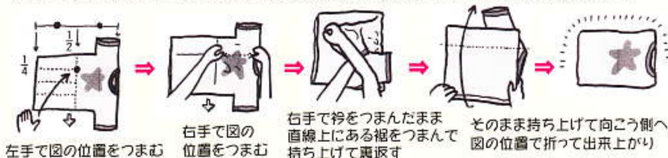
左手で図の位置をつまむ

まずは襟が自分の右に来るように置いて、左手で図の位置をつまむ。右手で直線上にある襟の横をつまむ。左手はそのままにして、右手で持った部分と裾の部分とを重ねるようにつまんで持ち上げて裏返します。残った袖部分をキレイに重ねれば完成です。