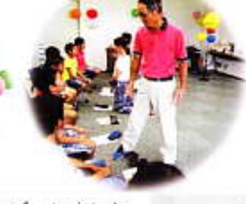
質問もいっぱいしました