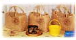
エコクラフトのバッグ