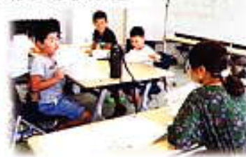
ALT のイアン先生、ロビン先生、アンジェラ先生とコミュニケーション!!