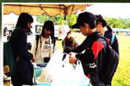
愛別の中学生も仲良くお手伝い