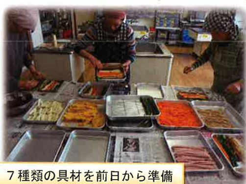
7種類の具材を前日から準備