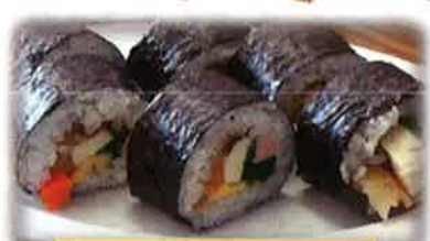
完成した太巻き寿司