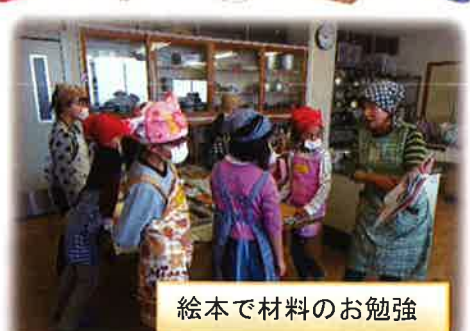
絵本で材料のお勉強