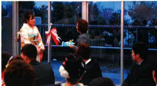
更生保護女性会様からの記念品贈呈