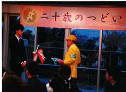
交通安全協会様からの記念品贈呈