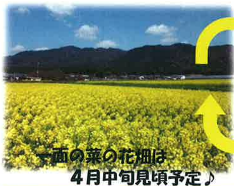
一面の菜の花畑は 4月中旬見頃予定♪