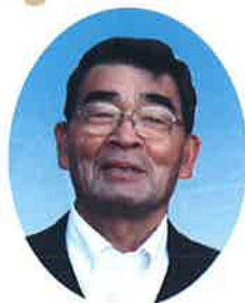
愛東地区まちづくり協議会

結びに、市民の皆様にとりまして本年が幸多き一年となりますことを祈念し、新年の挨拶といたします。