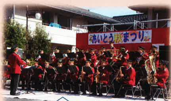
カッコイイ！消防士さんの演奏！