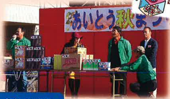
各種 16 店舗 のバザー出店