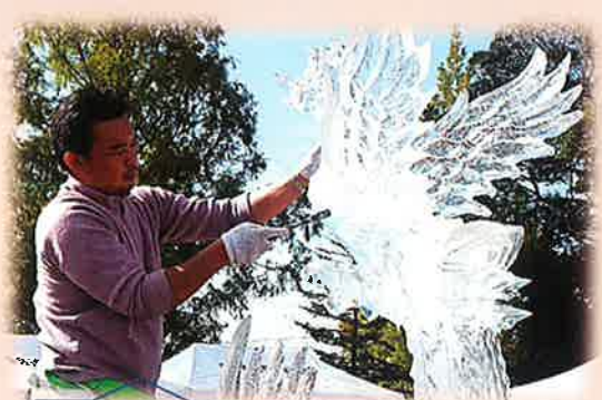
氷彫刻の実演『鳳凰』