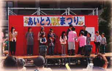
命のバトン啓発標語と 絵の作品表彰式