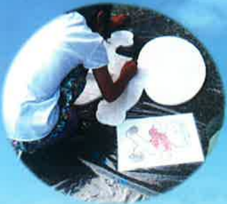
まず、下絵を描いて