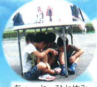
ちょっと、ひと休み

10月2日(日)愛東地区子ども会連合会で「飛び出し坊や」を作成しました！個性あふれる作品ができ、子どもも大人も大満足！あいう文化まつりで展示したあとは、各自治会に設置予定です。ぜひ、探してみてくださいね♪