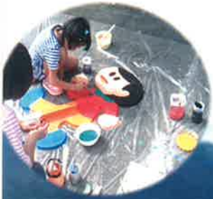
はみ出さないように・・・