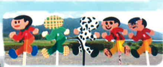
愛東地区子ども会連合会事業