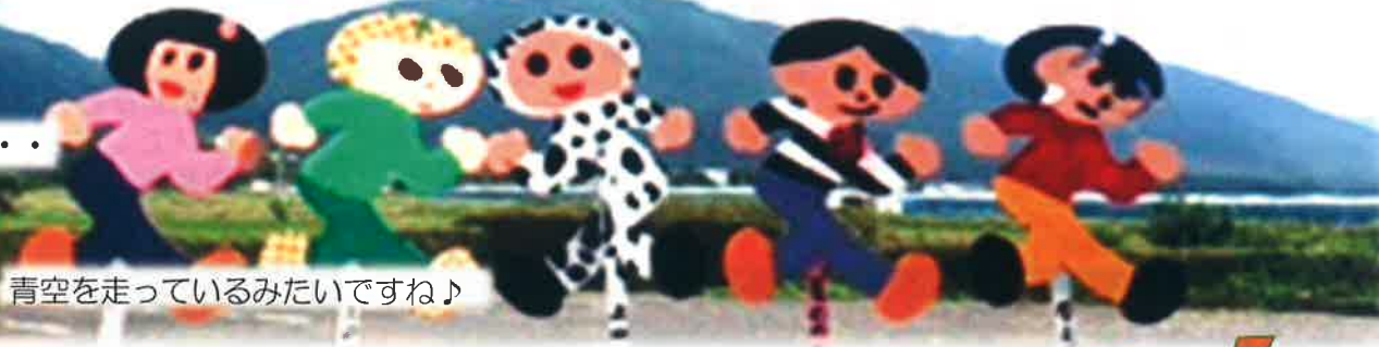
青空を走っているみたいですね♪