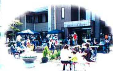
チャリティフェスティバル