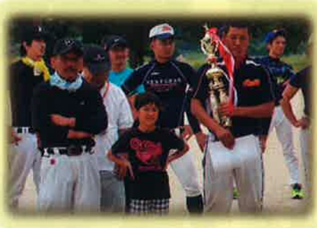
優勝した鮎江チームのみなさん