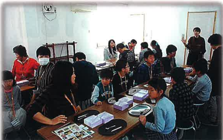
職人さんのように真似できるかな?!心配だけど楽しみ!

京菓子づくりでは和菓子製造1級技能士の職人さんが丁寧に教えて下さいました。プロの技も目の前で見ていただけましたよ。一流に触れられる時間が過ごせ、貴重な体験となりました。