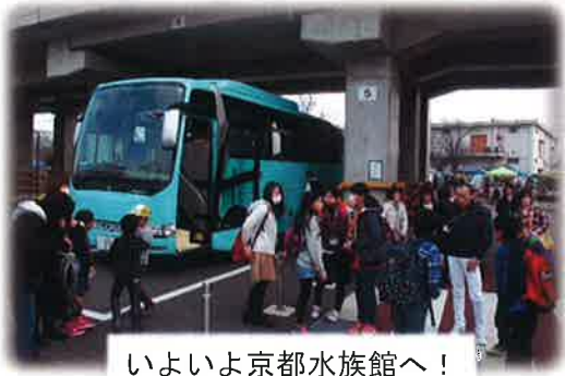
いよいよ京都水族館へ！