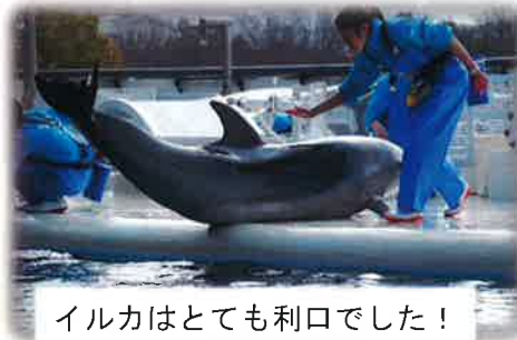
イルカはとても利口でした！