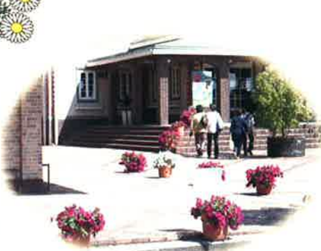
マーガレットステーション