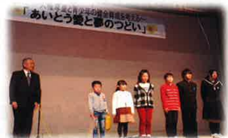
発表者、表彰者の皆さんは大きな舞台上で 緊張しましたが、立派に発表できました