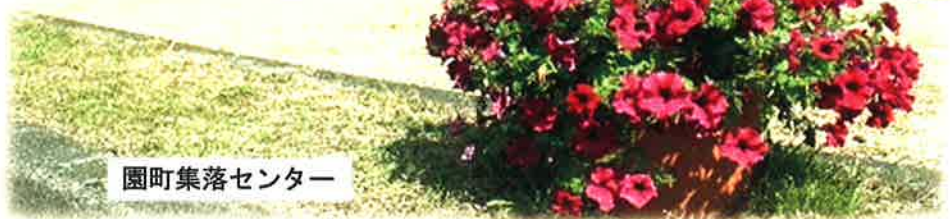
園町集落センター

花街道は、まちづくり協議会の「花づくり部会」が中心となって推進しています。今年はその地区内の16の自治会や花好きの方々のご協力を得て、総数400個の「水やり省力プランター」をお世話いただいています。 来年も、更にプランターの数を増やし、花街道の輪を広げる予定ですので、どうぞご期待下さい。 尚、この花街道づくりを手伝っていただける方を常時募集中です。お力をいただける方は左記へお電話下さい。お待ちしております。