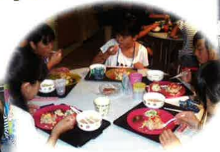
安全サポーターさんが一緒に登校してくれました

7月8日(水)～11日(土)までの3泊4日、コミュニティセンターで今年8年目となる通学合宿が開催されました。小学5、6年生対象に男子6名、女子15名の21名が生活体験しました。早起きしてしっかり食べて、挨拶もでき、よく頑張った3泊4日の通学合宿でした。これからも自信を持って何事も挑戦してください。