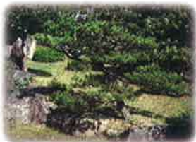
綺麗になった中庭

毎年、コミュニティセンターの中庭や周辺の除草作業をしてくださっています。今年度は7回作業をさせていただきます。暑い日も寒い日も朝早くから作業して下さりありがとうございます。