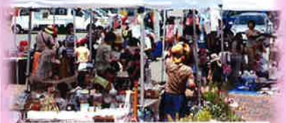
子育てサークル楽☆Raku 主催

5/30(土)開催の『ママの手作り市』は200名余りのお客さんで大賑わいでした。スタッフの皆さん、ご苦労様でした!