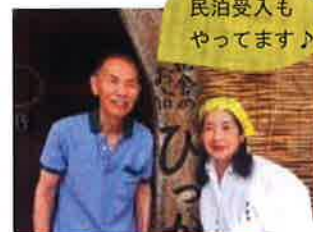
民泊受入もやっています!

また畑の畝の作り方からまき時まで、近所の方が教えてくれました。最初の2年はサルも食べにきませんでした。3年目からくるようになったのでサルにも認めてもらえたかな?