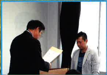
市からの事務嘱託員の委嘱の様子

★まちづくり協議会と協働し連携しながら、愛東地区の未来にむけて、どのように活動していくかを検討する予定です。