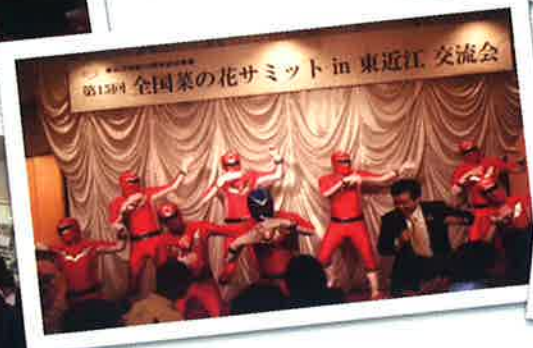
▲ 交流会では赤レンジャイが登場☆三日月知事も踊る! 踊る!