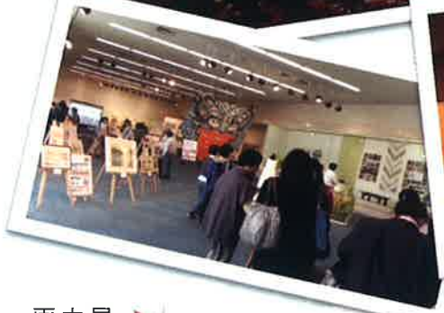
展示室では東近江の紹介 大鳳・近江麻・ヨシペン 画・平和祈念館などなど