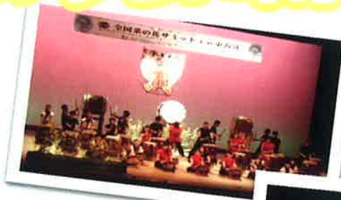
市内太鼓グループの合同演奏 鼓動に会場が感動!