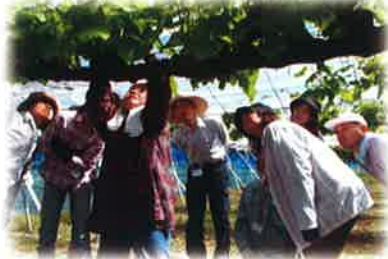
愛エコぶどう倶楽部 (愛東外)