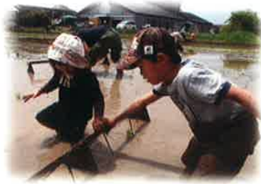
一からの米づくり (妹)