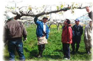
愛エコ梨倶楽部 (大林他2園)