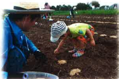
一からの味噌づくり (妹)