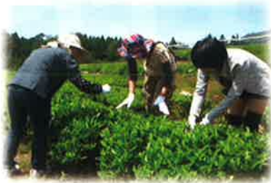
お茶っばーず (愛東外)