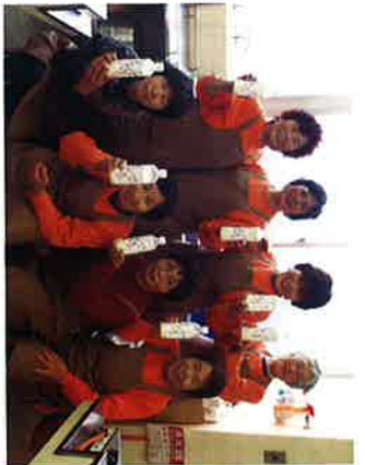
愛のまちエコライン

びわ湖を守るうと母さんたちが立ち上がりました。使ったあとの天ぷら油が、汚れ落ちのいい粉せっけん「愛しやぼん」に生まれ変わります。今や県外からも注文のくる人気商品！