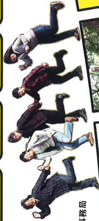
愛のまちエコ倶楽部事務局