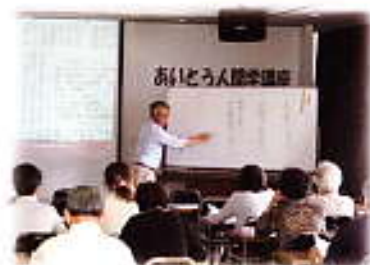
第2回は良寛さんを学ぶ 6/17

何かの徳を もたらしま す。受講者 の方はまさ にこれを実 感されたの ではないで しょうか