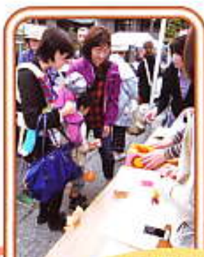
たまごのつかみ取り