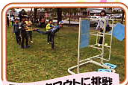
ストラックアウトに挑戦