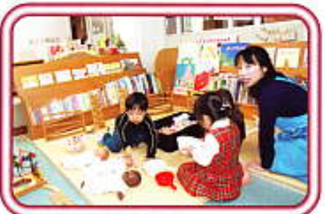
知育おもちゃで遊ぼう！