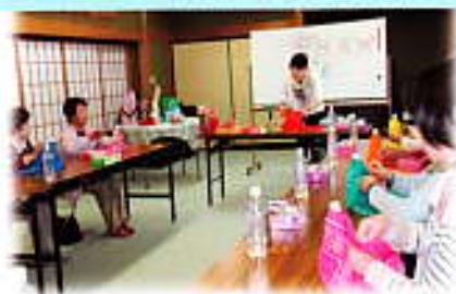
みなさん、真剣です！