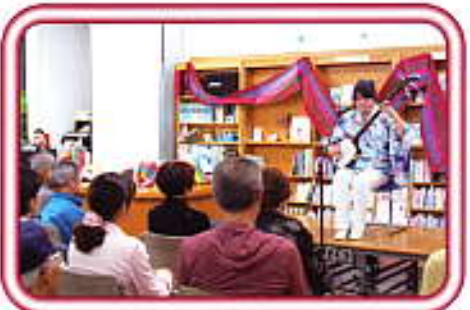
津軽三味線ライブ