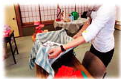
エコバックでお買い物♪