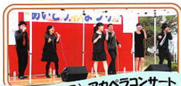
BLESS(ブレス) アカペラコンサート