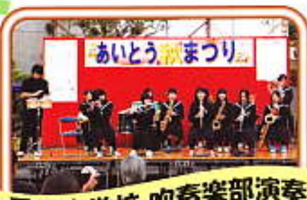
愛東中学校 吹奏楽部演奏