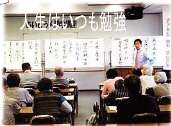
第1回は哲学者 森信三さんに学びました 5/17