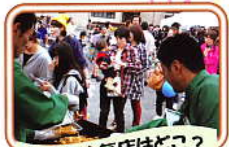
パスヤー人気店はどこ?