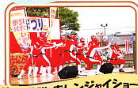
商工戦隊 赤レンジャイショー