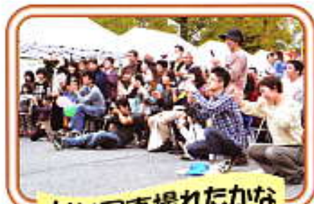
いい写真撮れたかな