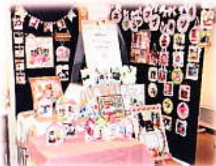
スクラップブック作り 作品