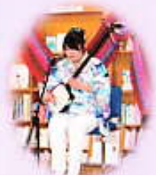
津軽三味線ライブ 11/3