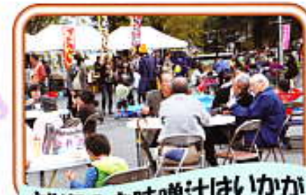
減塩のお味噌汁はいかが