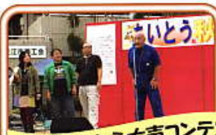
お腹の底から大声コンテスト