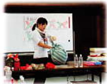
まんまるスイカも簡単に持ち運べます。