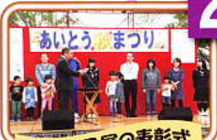
各種作品展の表彰式