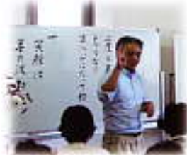
第4回は、過去の講座に出ていた名言を振り返って学びました。 8/23