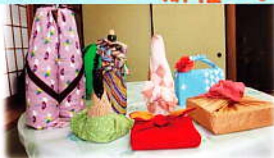
どんなものでも自由自在に包めます。