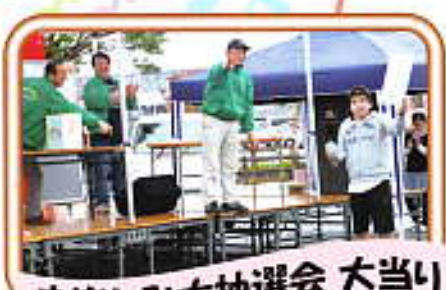
お楽しみ大抽選会 大当り