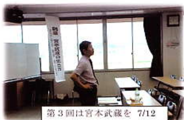
第3回は宮本武蔵を 7/12