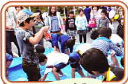
ガンバシもろこつかみ