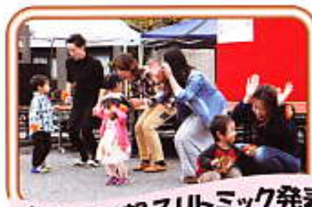
かわいい親子リズム発表