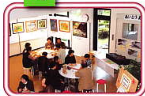
うたごえ広場公開講座