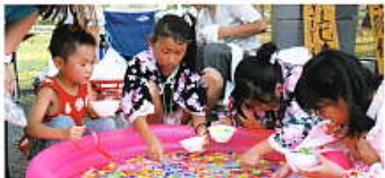
真剣になるスーパーボールすくい