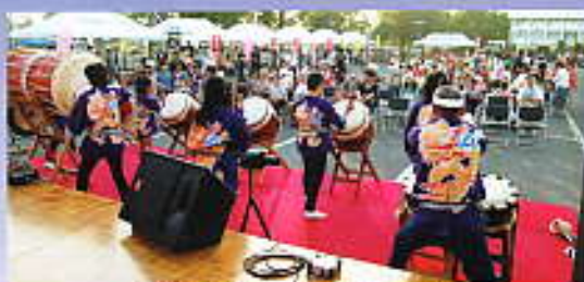
若鮎太鼓オンステージ