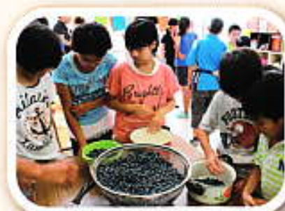
楽しくジャム作り