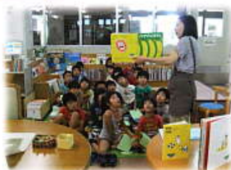
愛東南小2年 21名のみなさん

とても暑い中、小学校から歩いて きてくれました。図書館の使い方な どのおはなしの後、絵本を興味津々 に聞き入り、最後は思い思いの本を 借りて帰って行かれました。