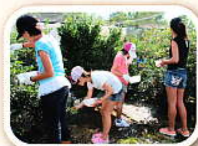
ブルーベリーの摘み取り体験