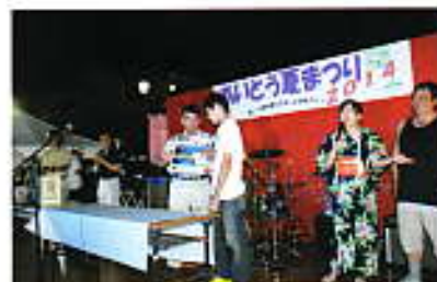
抽選会特賞ユニバエアチケット