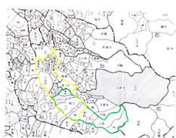
▲ 西小椋村をめぐる合併案