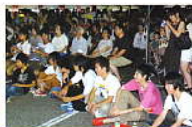
みんなで応援! 高校生バンド