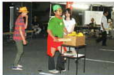
メロンマンのバナナのたたき売り