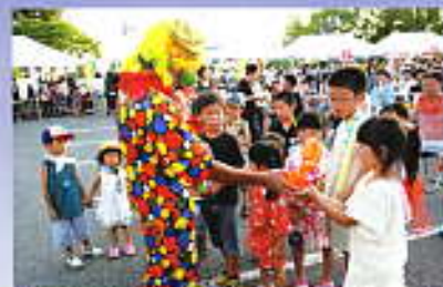
ピエロさんのバルーンアート