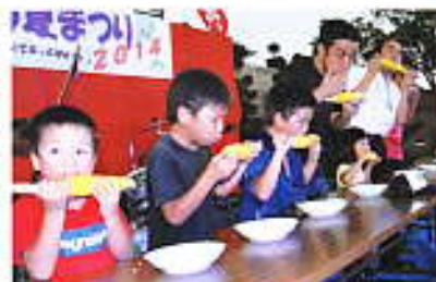
とうもろこしの早食い!