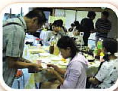
ちょっと緊張の名刺交換