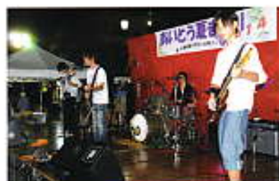
高校生バンド、オニオンヘッド