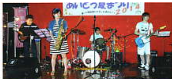
スペシャルゲスト、シックスビート