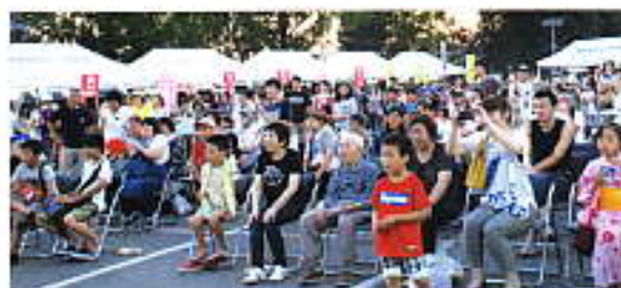
チャンピオン目指してガンバレー!