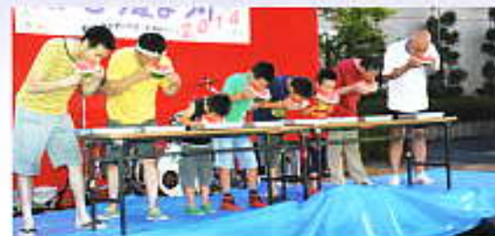
スイカの早食い王選手権