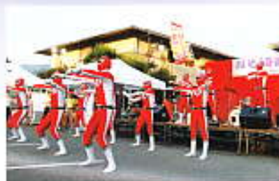
商工戦隊赤レンジャイ登場!