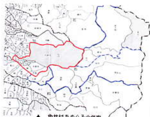
▲ 角井村をめぐる合併案

しかし、角井・西小椋両村とも、それぞれの要望は県によって認められることはありませんでした。もしこれを認めれば、その周辺の村とのバランスが取れないというのが主な理由でした。このようにして決まった地方区画が、一二五年後の今も生き続けています。