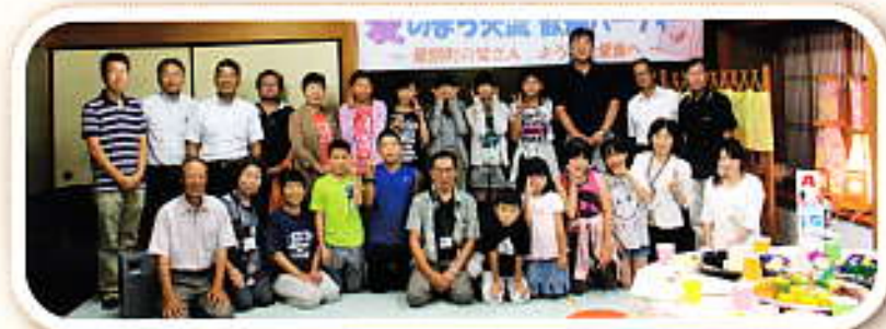
ホームステイ先の家族と一緒に