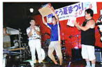
人気店1位 商工会青年部