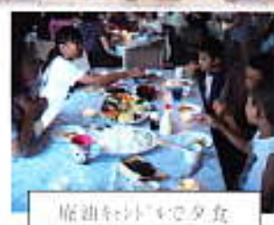
麻油を搾りながら夕食