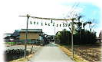
▷八日市地区妙法寺町の勸請吊