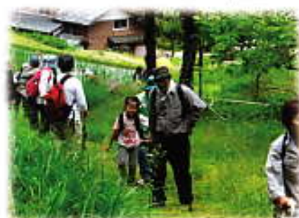
▷6月1日に予定している里道ウォーク(今年の写真)