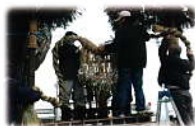
▷青山町の勸請吊取り付けの様子