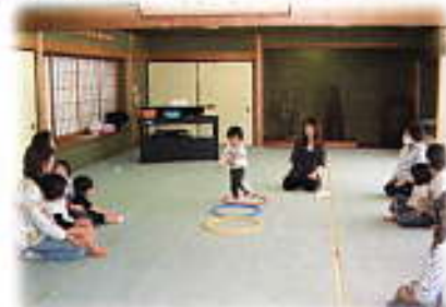
▷5月9日からスタートした リトミック教室

多くの方に学んでいただこうと、今年も盛りだくさんの講座を企画させていただきました。お陰様で、募集と同時にたくさんの方からお申し込みいただき、誠にありがとうございます。皆様喜んでいただけるよう、工夫を重ね努力してまいりますので、よろしくお願いたします。左の表は前期にスタートする講座（5月9日現在）です。定員に達していない講座は、随時受付しておりますのでお申込み下さい。