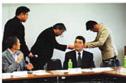
市からの事務嘱託員の委嘱の様子

まちづくり協議会と協働し連携しながら、愛東地区の未来にむけて、どのように活動していくかを検討する予定です。