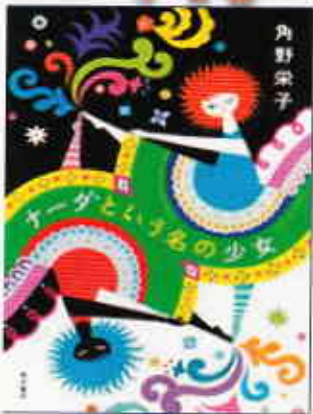
「ナーダという名の少女」 角野栄子/作 角川書店

カルナバルの国ブラジルで、日本人の父をもつ15歳のアリコはナーダという不思議な少女と出会う。サンバのリズムとカルナバルの響き、美しい街の様子を描きながら少女の心の成長と明かされていくナーダの秘密・・・