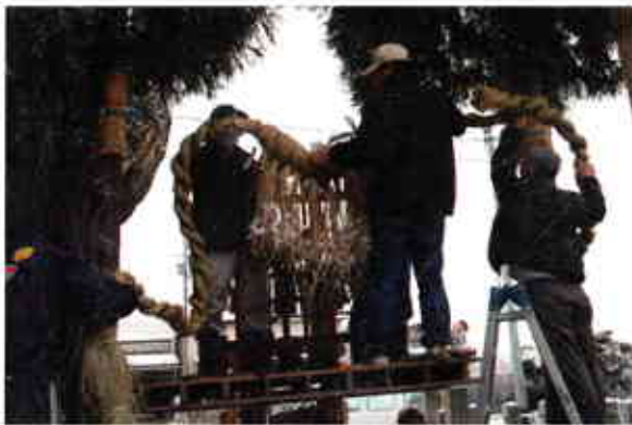
▲青山町の勸請吊取り付けのようす