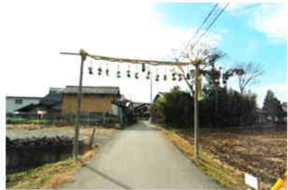
▲八日市地区妙法寺町の勸請吊