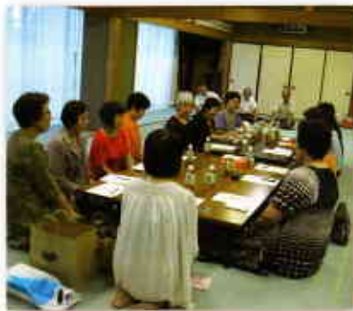
▲コミュニティターの和室で交流を深めました

同じ名前ということもあり、初めてとは思えないくらい、わきあいあいとした雰囲気、交流会が行なわれました。ホームステイの受入や、子どもがお世話になったと、活動以外にも話しに花が咲きました。