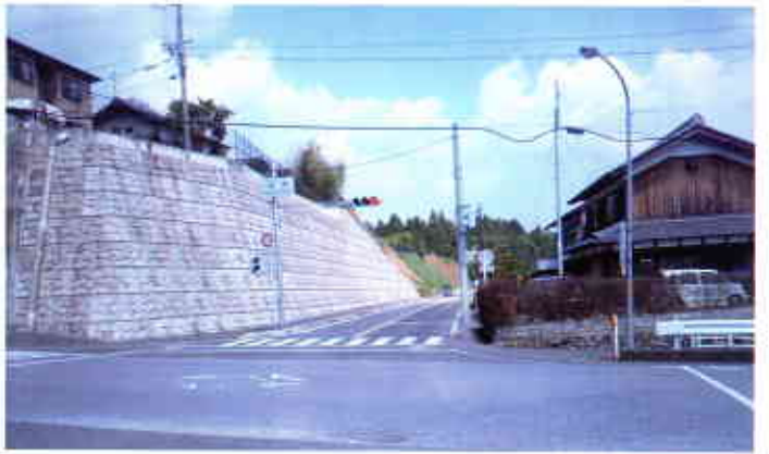
▲妹町を上下に分ける河岸段丘