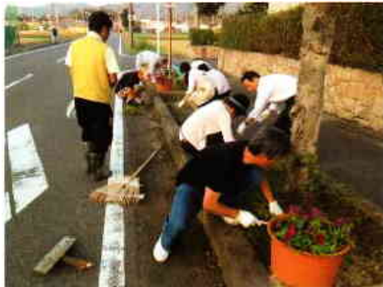
▲プランターの周りの草取りは沿線の人の協力で

愛東診療所前の道路に、きれいな花の咲いたプランター50個がきれいに並んでいることにお気づきでしょうか。