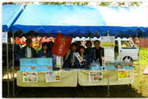
▲フェスティバルでの販売のようす