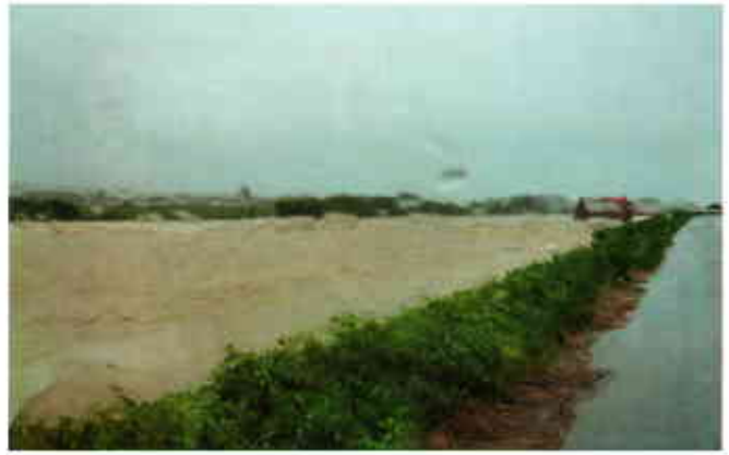
▲9月16日 堤防ぎりぎりの水位となった愛知川(青山頭首工付近)