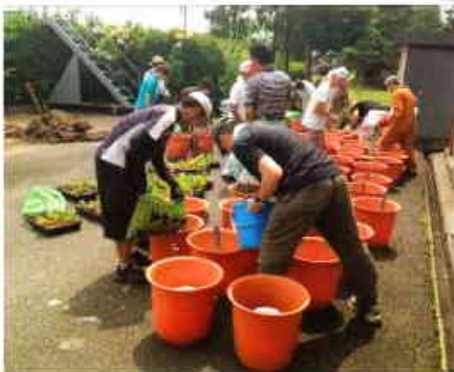
▲多くの人の協力で定植作業をしました