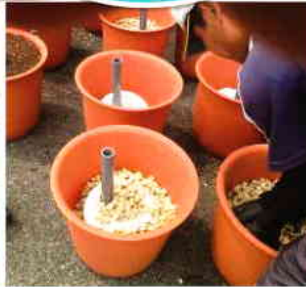
▲「水やり省カプランター」の開発の要の部分

愛東診療所前の道路に、きれいな花の咲いたプランター50個がきれいに並んでいることにお気づきでしょうか。