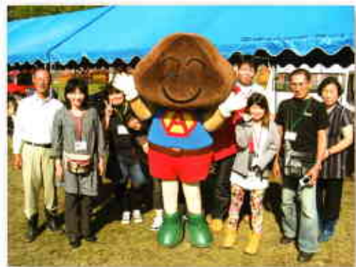
▲きのこキャラクターの「あいちゃんマン」と