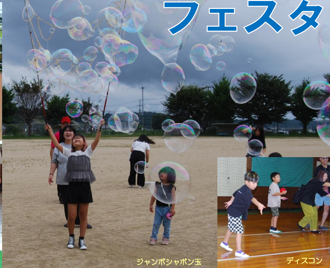
ジャンボシャボン玉