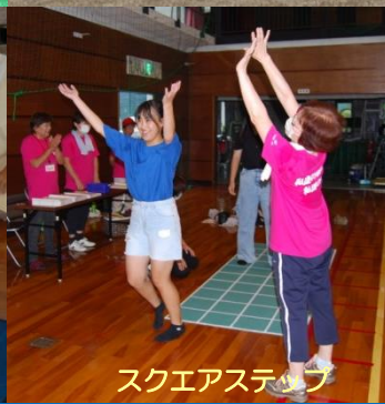
スクエアステップ