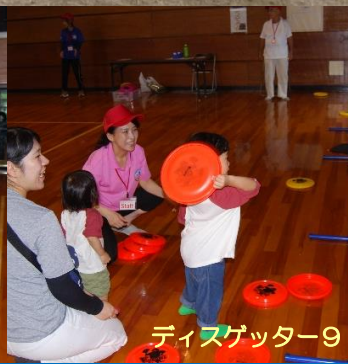
ディスクゲッター9