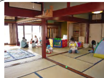
やまびこの家での子育て支援