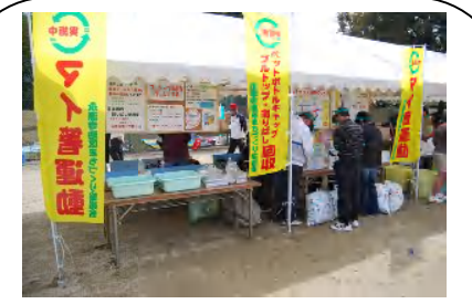
運動会でのリサイクル活動