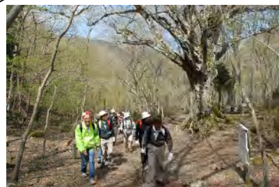
わがまち探訪・千草街道を往く