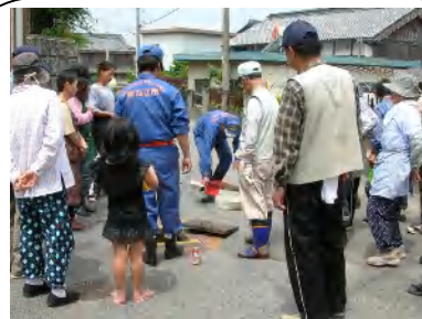
自主防災組織による訓練