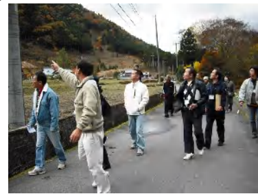
田舎暮らし体験ツアー