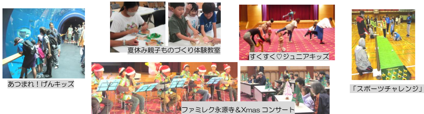
内容や応募方法は追ってチラシ等でお知らせします。