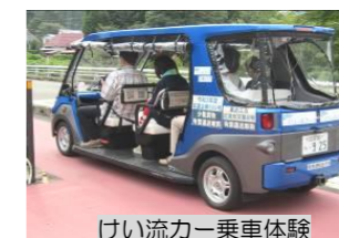
けい流カー乗車体験