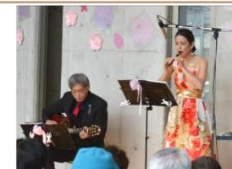
「春うたコンサート」はなちゃんず