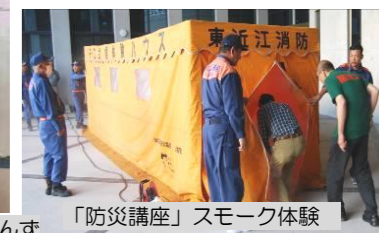
(写真は昨年の様子です)