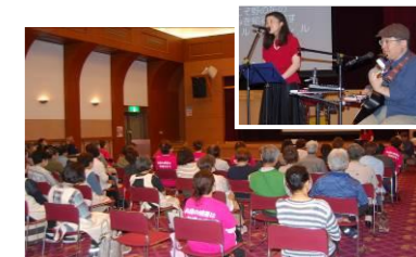
「元気フェス」歌声喫茶 わ音